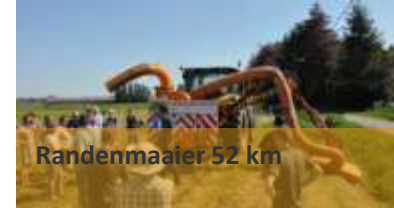
Randenmaaier 52 km