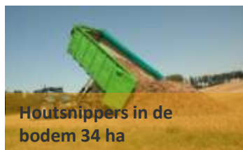
Houtsnippers in de bodem 34 ha