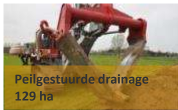
Peilgestuurde drainage 129 ha