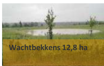
Wachtbekkens 12,8 ha