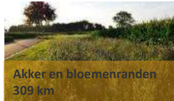
Akker en bloemenranden 309 km