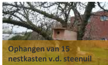
Ophangen van 15 nestkasten v.d. steenuil