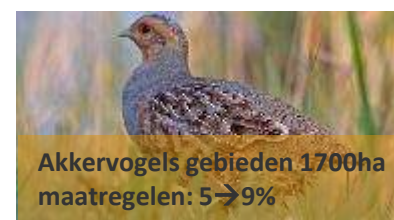
Akkervogels gebieden 1700ha maatregelen: 5→9%