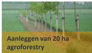
Aanleggen van 20 ha agroforestry