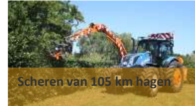
Scheren van 105 km hagen